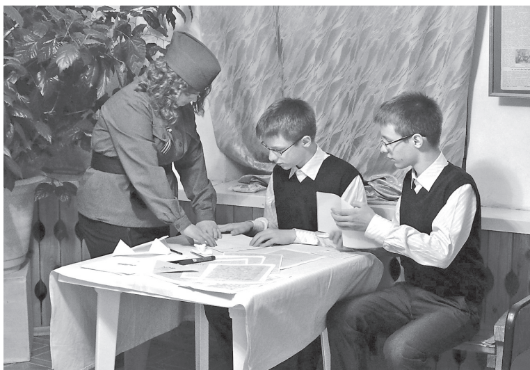
Рис. 2. Музейное занятие «Читаем письма с фронта»

В последнее время в практике нашего музея, особенно в рамках акций «Ночь музеев» и «Ночь искусств», стала использоваться такая форма культурно-образовательной деятельности, как ки-