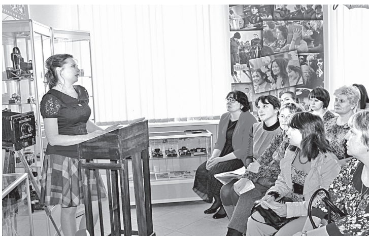
Рис. 1. Семинар «Музеи и дошкольные учреждения...»

Программа «Ручеек времени» включает в себя ряд мероприятий, разработанных на основе использования предметов этно-