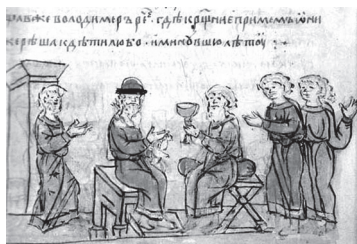
Рис. 1. Миниатюра из «Повести временных лет». Князь Владимир выслушивает ответы послов

Большую заинтересованность дети всегда проявляют к книжным миниатюрам древнерусских книг: им они что-то напоминают (рис. 1). Но что именно? Мы выяснили, что маленькие иллюстрации, выполненные как бы детской, неумелой рукой, в восприятии детей очень похожи на современные комиксы. И, как и комиксы, они подробнейшим образом иллюстрировали события, о которых