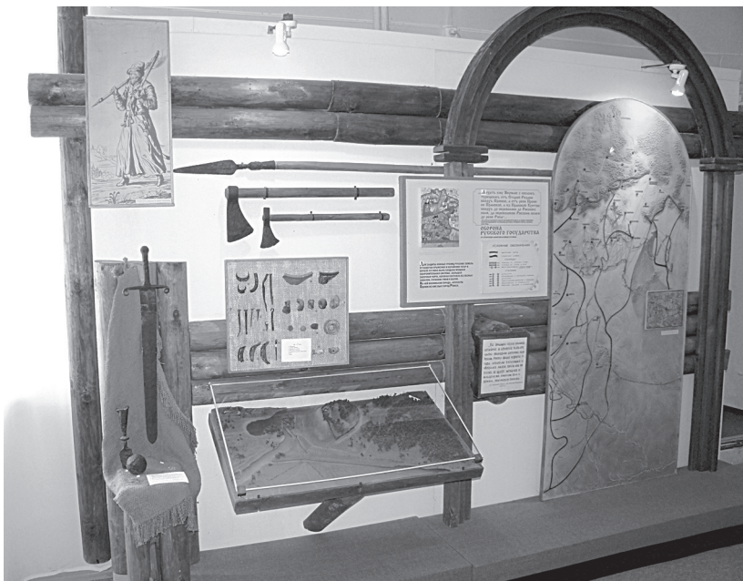
Рис. 2. Фрагмент экспозиции «Ряжск – город-крепость»

дарства и в новой южной оборонительной черте в середине XVI столетия оказался «Ряский город», а в 1557 г. была построена Ряжская крепость (рис. 2). На основе предметов и вспомогательных материалов, представленных в экспозиции, рассказывается об устройстве крепости, о постройках внутри нее, об организации жизни и сторожевой службы в посаде. После этого, для закрепления материала, задаются вопросы учащимся.