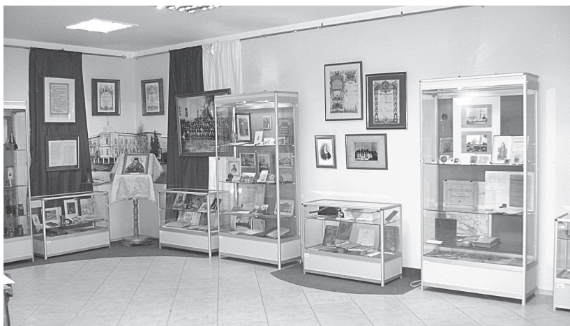
Рис. 2. Выставка «Да светит свет ваш перед людьми»

Выставка «Благая весть святителя-целителя Луки» представила тамбовский период жизни святителя Луки, его гражданское