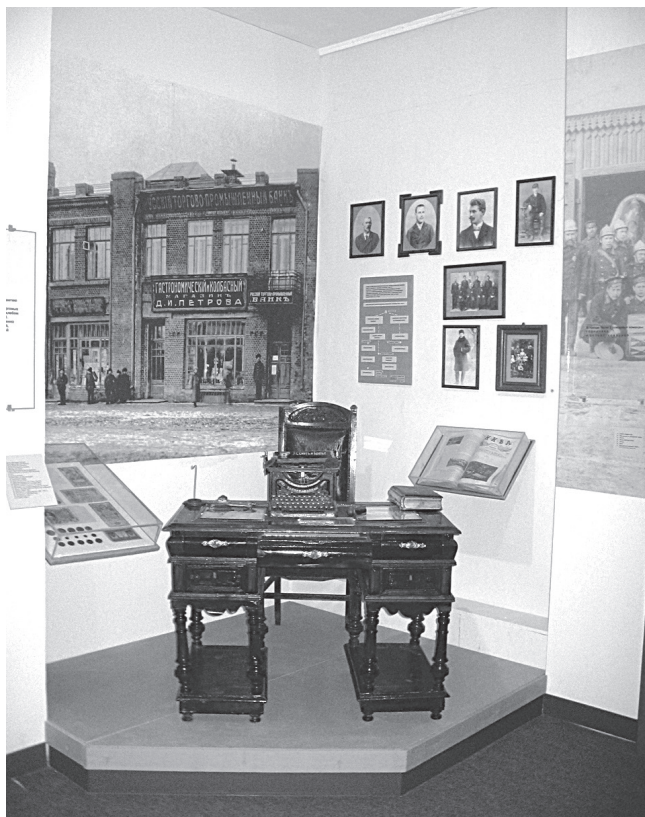
Рис. 1. Фрагмент экспозиции «Ряжск – город уездный»

Музейный урок «Ряжск – город-крепость» – это внеурочное занятие в рамках школьной программы «История России» (краеведение) для учащихся 8-х классов. Проводится на экспозиции, в зале «Ряжский край в XVI–XVIII вв.» и посвящен времени, когда в 1521 г. Рязанское княжество вошло в состав Московского госу-