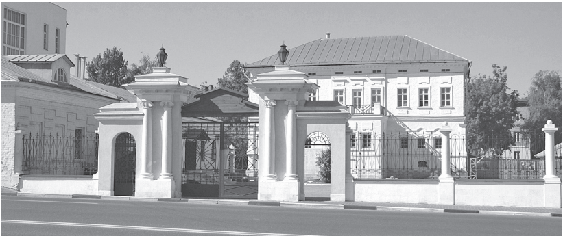
Рис. 1. Усадьба И.И. Лажечникова в г. Коломна

Усадьба И.И. Лажечникова (Отдел Историко-культурного музея-заповедника «Коломенский кремль») располагается в исторической части города Коломны, рядом с кремлем (рис. 1). Это редкий сохранившийся пример купеческого жилья XVIII–XIX вв. Здесь провел свое детство и юность писатель Иван Иванович Лажечников (рис. 2). Родовая усадьба принадлежала его бабушке, а потом родителям – семье богатых коломенских купцов Ложечниковых, историю которой можно проследить еще с XVII века. Ложечниковы всегда занимались торговлей; во второй половине XVIII в. бабушка писателя Илья Акимович Ложечников был купцом первой гильдии. Расхождение в фамилии писателя и его семьи объясняется тем, что Иван Иванович впоследствии перешел в дворянское сословие и в середине XIX в. внес фами-