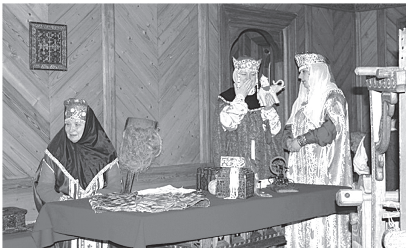
Рис. 3. Музейная программа

Использование предметов материальной и духовной культуры, а также памятников нематериального наследия зависит от цели конкретной музейной программы. Культурно-образовательная деятельность музея, прежде всего, направлена на школьную и студенческую аудиторию. При этом, восприятие письменных источников данной аудиторией имеет свои особенности. Так, рабо-