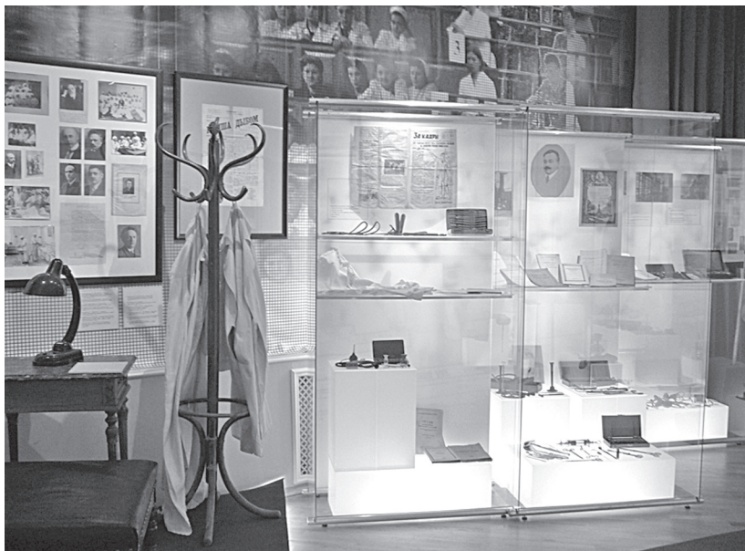
Рис. 1. Фрагмент экспозиции Музея истории медицины Первого МГМУ им. И.М. Сеченова. Фото 2016 г.