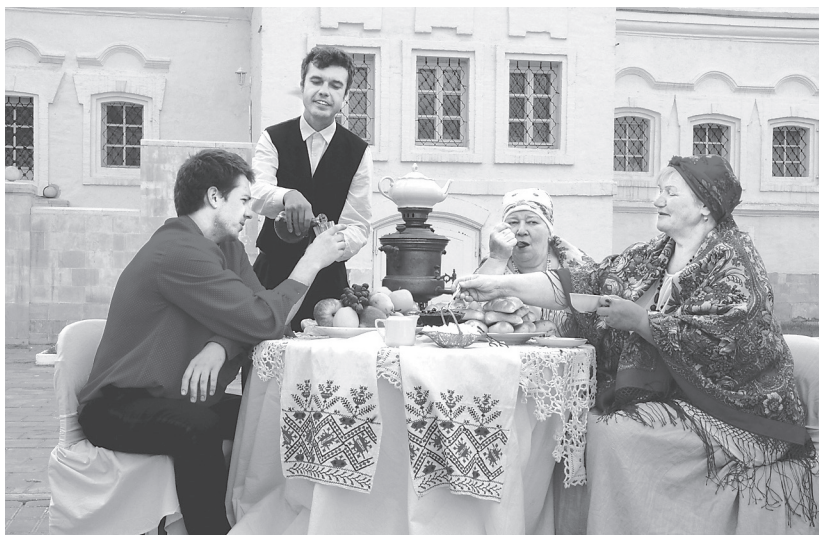
Рис. 3. Музейная программа «В купеческой усадьбе»

Составлению сценария предшествовала научно-исследовательская работа над документами в фондах музея, например, использовались отчеты первой коломенской общественной би-