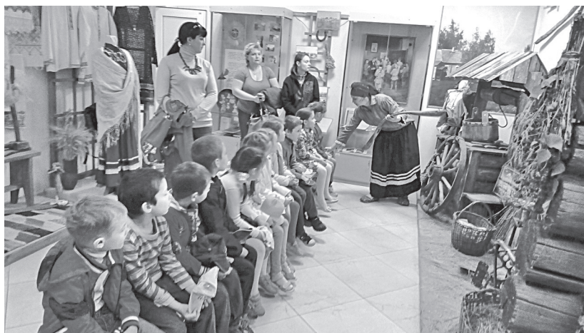
Рис. 2. Занятие с детьми из детского сада «Золотой ключик» в рамках программы «Ручеек времени»

Дошколята попадают в удивительный и волнующий мир прошлого. На первом занятии дети знакомятся с русской избой (рис. 2). Им интересно все: как устроен крестьянский двор, что находится внутри избы. Они узнают много новых слов – «закут», «красный угол»; начинают понимать функциональное назначение многих предметов (для чего нужна печь, ступа с пестом или ухват, что такое «зыбка»). Внимание детей целенаправленно об-