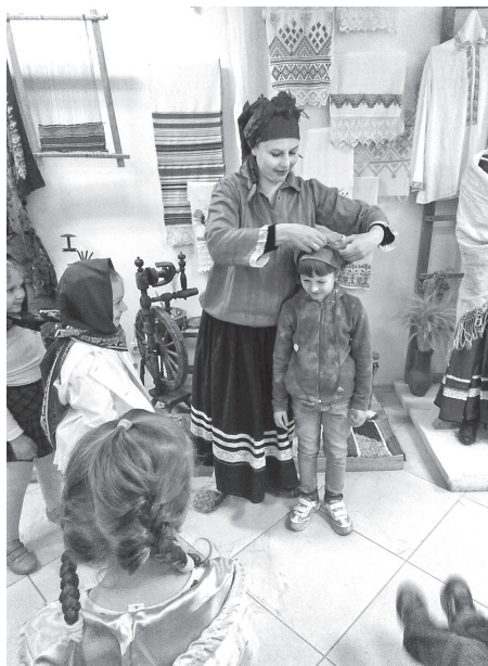
Рис. 3. Знакомство с тамбовским крестьянским костюмом. Занятие с детьми из детского сада «Золотой ключик» в рамках программы «Ручеек времени»

На каждом следующем занятии дети знакомятся с новым аспектом крестьянской жизни на примере небольшого количества музейных предметов. Мероприятие «О чем рассказала лучина» знакомит детей с такими предметами как светец, лучина, свеча, керосиновая лампа; им предлагается подумать, в какие современные бытовые предметы «превратились» эти вещи. Знакомство с элементами тамбовского традиционного крестьянского костюма – рубахой, запоном, поневой, кушаком, а также с традиционными занятиями крестьянок – ткачеством, прядением, вышиванием – происходит на мероприятии «Как рубашка в поле выросла» (рис. 3). Непосредственные действия с предметами способствуют успешному усвоению некоторых видов занятий того времени,