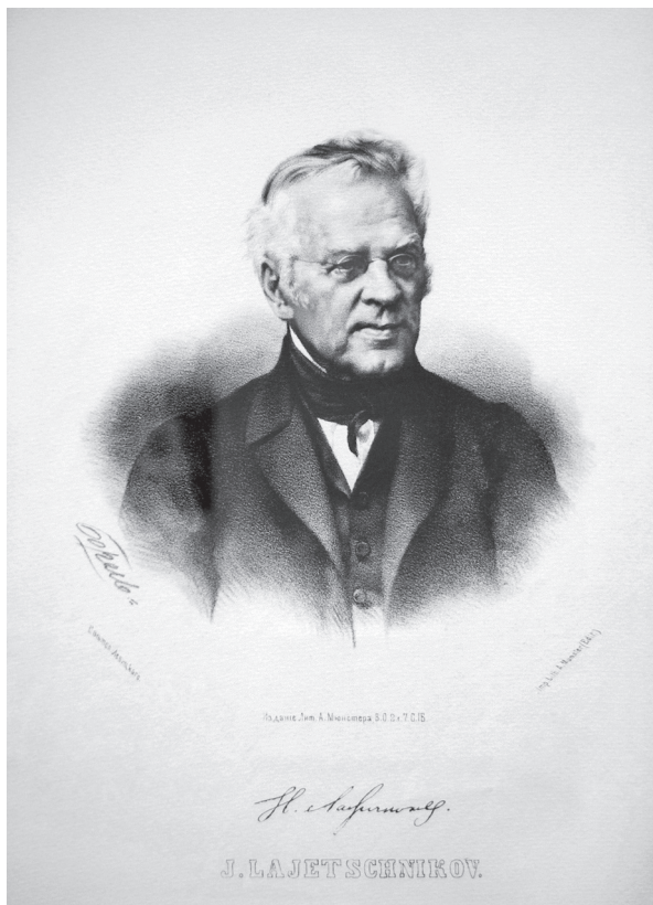
Рис. 2. Лажечников И.И. Лит. А. Мюнстера

лию своей семьи в дворянскую родословную книгу как фамилию Лажечниковых.