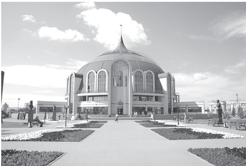
Рис. 1. Тульский государственный музей оружия