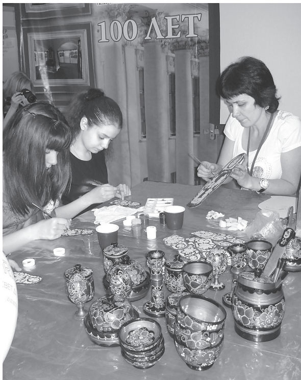
Рис. 3. На мастер-классе по касимовской росписи

Таким образом, эффективность использования музейных источников в культурно-образовательной деятельности музея-заповедника во многом определяется разнообразием форм работы с музейной аудиторией.