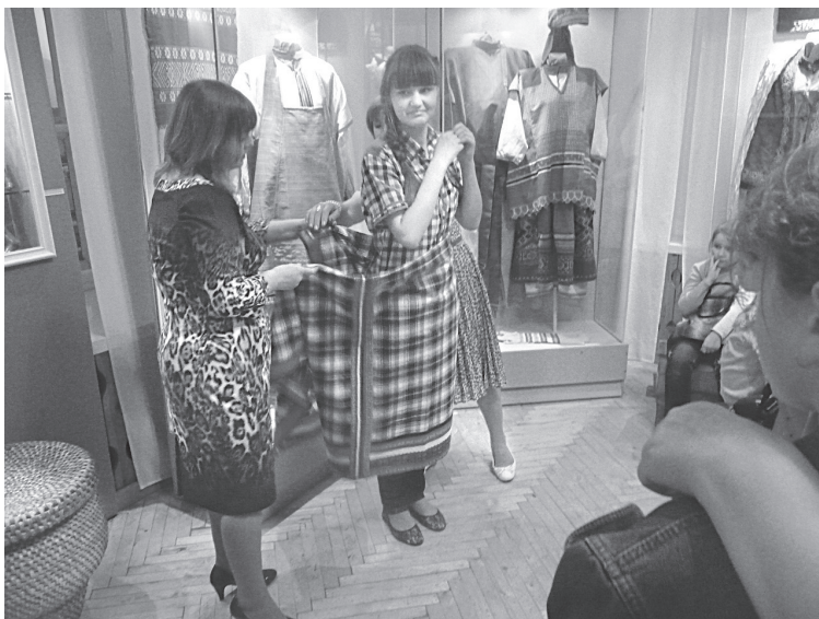
Рис. 1. Экскурсия для школьников. Надевание поневы

Вещественные источники мы используем довольно широко. Например, очень часто для культурно-образовательных мероприятий требуется воссоздание какого-либо интерьера. Тогда мы используем предметы для того, чтобы погрузить посетителей в атмосферу сказки, народных гуляний, крестьянского быта и т.д.