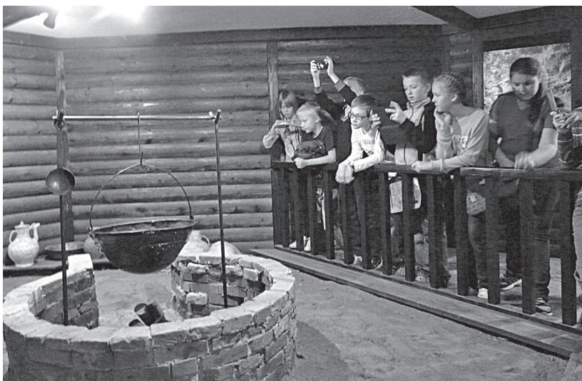
Рис. 2. Занятие со школьниками на экспозиции