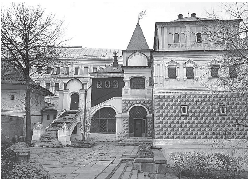
Рис. 1. Музей «Палаты бояр Романовых»