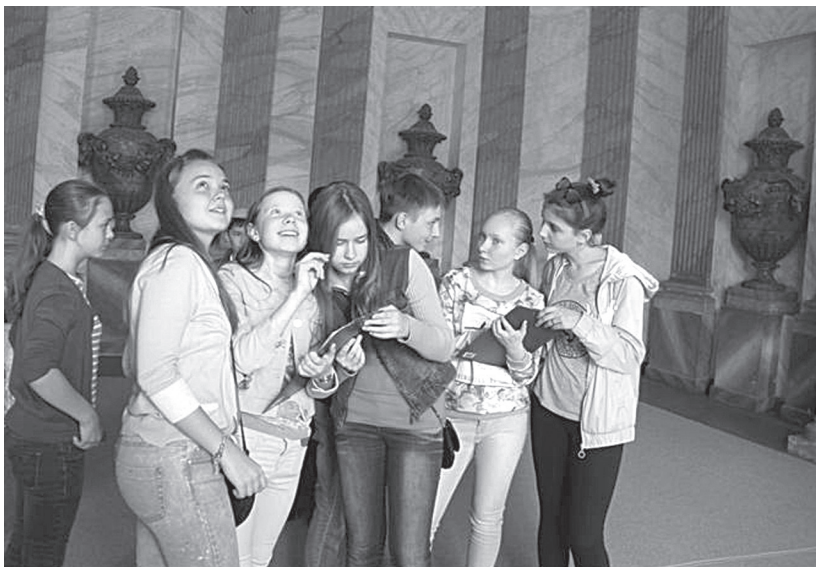
Рис. 1. В рамках проекта «Урок в музее» проводится урок истории во дворце Музея-усадьбы Кусково

Для школьников 8–11 классов разработан урок английского языка «Welcome to Kuskovo» (автор – н. с. Ерастова С.В.). Усваивать тематическую лексику, связанную с темой «Путешествие» гораздо интереснее на подлинных музейных экспонатах. Этот необычный урок предваряет небольшая экскурсия на английском языке, повествующая об истории усадьбы Кусково и рассказывающая о художественном убранстве дворца, сохранившего подлинные интерьеры XVIII в. Далее школьники сами становятся активными участниками урока: пользуясь специально разработанными рабочими листами, выполняют разнообразные устные и письменные задания. Цель данного урока – применение полученных знаний на практике. В ходе музейного занятия каждый ученик может попробовать себя в роли гида и провести небольшую экскурсию, или рассказать о понравившемся экспонате музея на английском языке. Этот урок адресован как школам гуманитарного профиля, так и общеобразовательным школам.