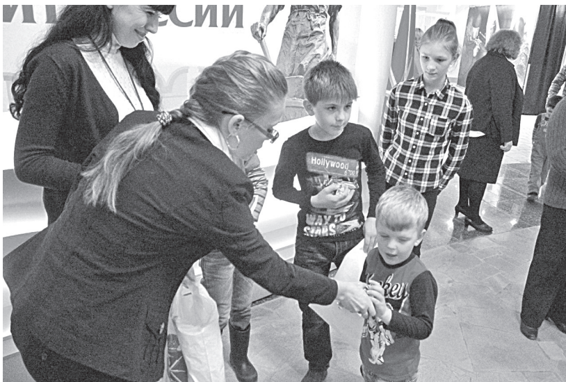
Рис. 3. Культурно-образовательная программа «Музейкина путаница»