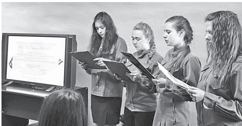
Рис. 3. Историко-поисковый проект «Женская снайперская школа. Кусково»