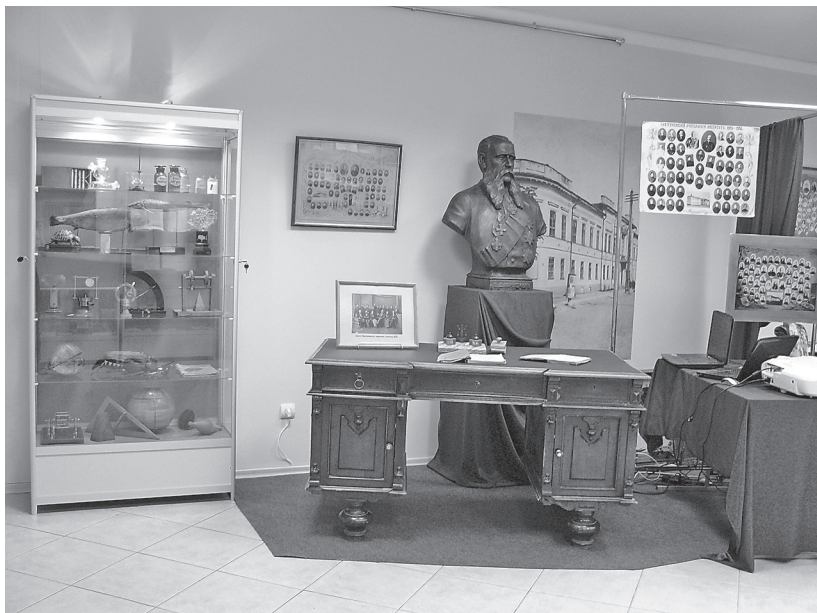
Рис. 1. Экспозиционный зал «Традиции связующая нить»

За прошедшие с момента открытия зала годы здесь были размещены выставки, концептуально поддерживающие его основную идею, но очень разные по своему содержанию и наполнению. Например, выставка, посвященная деятельности Тамбовского ин-