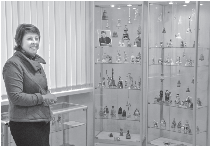
Рис. 3. Выставочный проект «Территория увлечений» в Зале выпускников