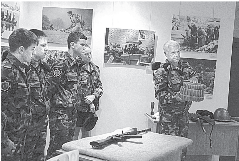
Рис. 2. Урок в музее