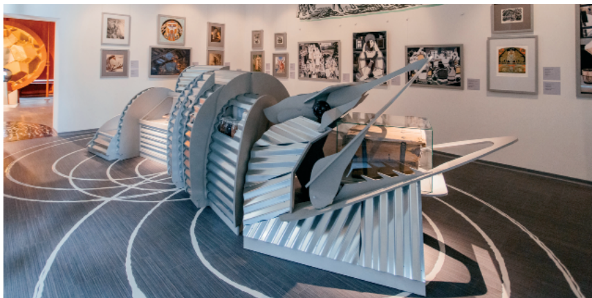
Рис. 2. Экспозиционный раздел «Противостояние и слияние»

Проводник зала – герой кузнец Илмаринен. Символом зала становится огромная щука, образ которой связан с Илмариненом в сюжете его сватовства. Т. к. взаимоотношения мужчин Калевалы и дев Похьелы сводятся в повествовании к кульминации – к свадьбе, которая традиционно представляется в виде длительного и развёрнутого обряда, символом зала стал «предмет» одного из испытаний жениха перед свадьбой. При этом «выпрыгивающая из воды Щука» – это многофункциональная витрина с произведениями декоративно-прикладного искусства, ёмкостями для ароматов (дэготь, хвоя) и ингредиентов пива Осмотар. В драйверах витрины размещается символический «сундук невесты с приданым»: образцы вышивки и ткачества, шаль, элементы головного убора и украшения (рис. 2).