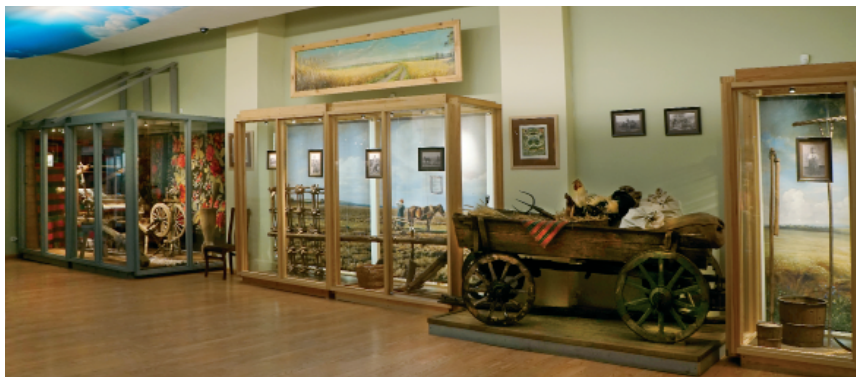
Рис. 1. Экспозиция Орловского краеведческого музея

В последние годы музей прочно вошёл в систему дополнительного образования во многих образовательных учреждениях г. Орла и Орловской области, стал центром по реализации экспериментальных программ по краеведению и изучению традиций народной культуры. В связи с этим сотрудниками музея используются разнообразные формы работы: театрализованные экскурсии, познавательные-развлекательные занятия, игры-викторины, олимпиады, мастер-классы и др.