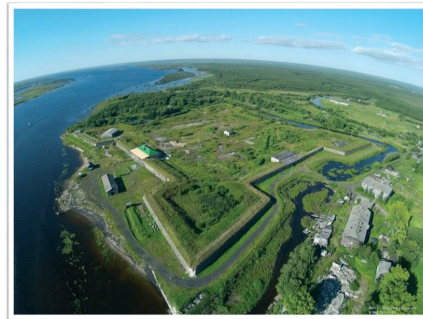
Рис. 2. Филиал Архангельского краеведческого музея «Архангелогородская Новодвинская крепость», 1701–1721

В 2007 г. музею передан ещё один объект истории и культуры федерального значения – памятник фортификации начала XVIII в. «Архангелогородская Новодвинская крепость», первая каменная бастионная приморская крепость в России (рис. 2). Сегодня на территории крепости