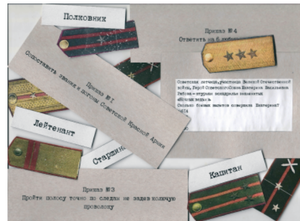
Рис. 2. Квест-игра «За Победой!»

На наш взгляд, музейный квест уже по своему определению – музейный – должен включать в себя краеведческую информацию, но она не должна превалировать над игровой, развлекательной и подвижной составляющей мероприятия. Ведь тогда это уже урок, а не игра. Также для квестов важна не только его наполненность информацией и игровыми моментами, но и общая атмосфера, разные нюансы и детали. Т. е. для поиска клада нужна карта. Если это детектив, то у участников квеста должны быть соответствующие инструменты для проведения расследования (лупа, фонарик для чтения скрытых надписей и т. п.). Если есть письменные подсказки или улики, то стиль их должен соответствовать времени, которое отыгрывается в квесте (например, если квест военный, то задания участники получают в виде приказов от командования) (рис. 2).