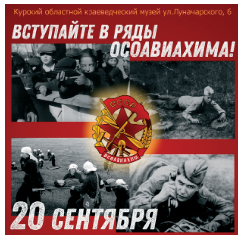
Рис. 1. Афиша квеста «Готов к труду и обороне»

Накануне 75-летней годовщины Победы в Великой Отечественной войне в Курском областном краеведческом музее (далее – КОКМ) был разработан квест «Готов к труду и обороне», посвящённый довоенной подготовке молодежи в секциях ОСОАВИАХИМа (рис. 1). ОСОАВИАХИМ – «опора