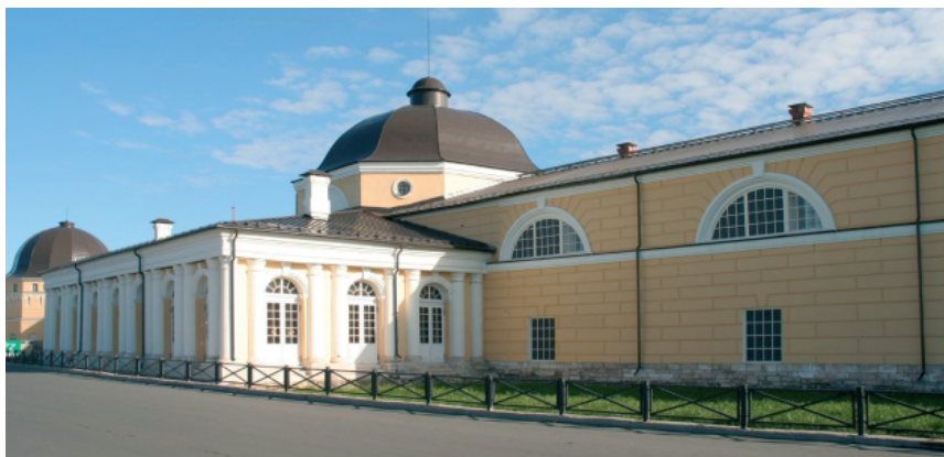
Рис. 1. Архангельский краеведческий музей. Располагается в зданиях Архангельских Гостиных дворов, 1667–1684

Сегодня Архангельский краеведческий музей – крупное научное и просветительское учреждение, современный выставочный и методический центр, располагающий обширным архивом и библиотекой, имеющий собственную научную реставрационную мастерскую. Музейное собрание насчитывают более 200 тысяч единиц хранения основного фонда и представляет собой крупнейшее комплексное собрание региона, составляющее половину музейного фонда Архангельской области.