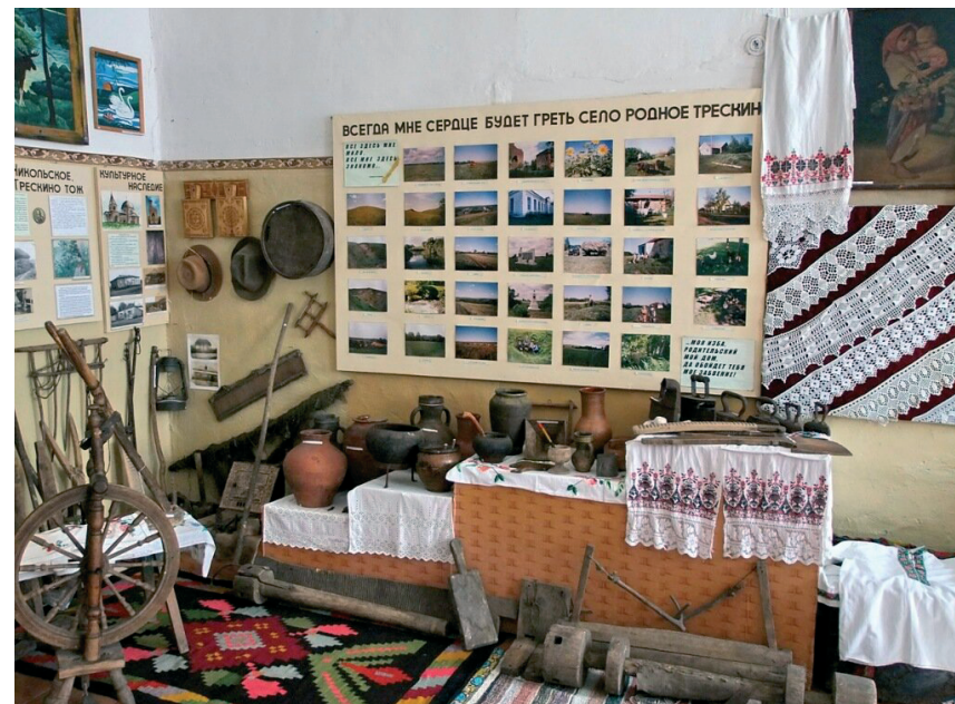
Рис.1. Экспозиция Музея истории с. Трескино Тамбовской обл.

Формирование института малого музея, прежде всего, связано с особенностью жизни небольшого сообщества людей, организации их микромира. Здесь существуют свои порядки, законы развития. Музей, как форма сохранения этого микромира и передачи традиций, обеспечивает преемственность культурно-исторического развития данного сообщества. Например, сельские музеи, собирающие и хранящие историю села, память о жителях, их достижениях и успехах. Это музеи истории сёл Лысые Горы, Тулиновка, Трескино (рис. 1) и др.; музеи предприятий, которые поддерживали и продолжали рабочие традиции, фиксировали свою роль в структуре хозяйственной жизни региона (заводов «Подшипники скольжения», «Ревтруд», «Аппарат», «Комсомолец» и мн. др.); отраслевые музеи, которые зафиксировали в своих экспозициях и фондах промышленное, хозяйственное и социокультурное развитие области (Музей истории Тамбовской почты, Музей истории театра, Музей истории Управления внутренних дел, Тамбовский областной народный музей образования и др.).