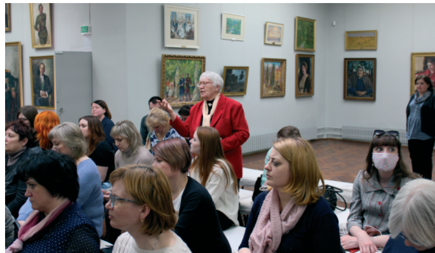
Рис. 8–9. Сессия в Музее-усадьбе А.М. Герасимова

городскую застройку, объекты историко-культурного наследия, наличие которых позволяет формировать самобытную историко-культурную среду, создавать необходимые маркеры для поддержания местной идентичности, в т. ч. музейными средствами. В Музее-усадьбе А.М. Герасимова прошла пятая сессия Научного совета « Политика музеев в актуализации и презентации материального и нематериального историко-культурного университета имени Г.Р. Державина. Мероприятия в Музее-усадьбе А.М. Герасимова были организованы при поддержке коллектива музея и старшего научного сотрудника А.Н. Базаркиной.