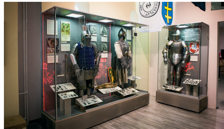
Рис. 2. Исторический музей Смоленского государственного музея-заповедника. Постоянная экспозиция

Один из самых брендовых регионов, презентующих эпоху Смуты, – Ярославский край. На четыре месяца 1612 г. Ярославль стал столицей страны, здесь собирались средства на ополчение, пришедшее из Нижнего Новгорода, выпускалась своя монета. Много лет обсуждалась концепция