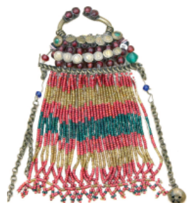
Рис. 2. Застежка-сюлгамо. Кон. XIX в.

Собирательным образом пространства в представлениях мордовского народа является также водоплавающая птица – Иненармунь, Покш ведь нармунь, обладающая ролью демиурга. В фольклоре мордвы–эрзи существует множество легенд, связанных с этой птицей. Согласно одной из них, Большая водяная птица Иненармунь несёт Мировое яйцо, из которого был сотворён мир: круглая земля была создана из зародыша яйца, из скорлупы появилась небесная и подземная твердь 5 . В тексте другой легенды мы находим строки о том, что Иненармунь на большом поле (в других сказаниях – сидя на ветвях Мирового древа) свила гнездо из волос девушки, снесла три яйца и высидела трёх птенцов: соловушку, кукушку и жаворонка 6 . Частое использование соответствующих элементов – изображений и подвесок в виде крыльев, лапок в предметах быта, украшениях, одежде подчеркивало сакральную роль водоплавающих птиц. Так, в музейной коллекции хранятся зооморфные подвески рязано-окской культуры (одна из финских культур Поволжья) VII–X вв., среди декоративных элементов которых присутствуют лапки водоплавающей птицы, символа первоначала.