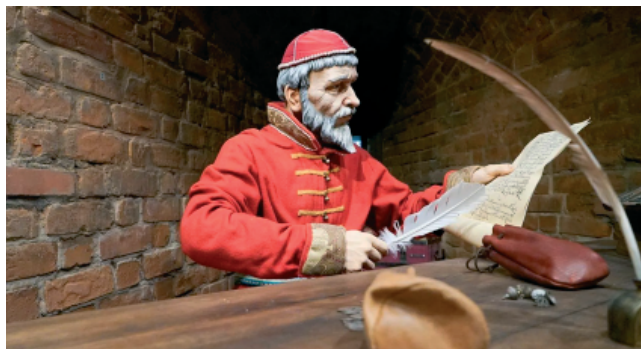
Рис. 3. Нижегородский государственный историко-архитектурный музей-заповедник. Экспозиция «Подвиг народного единства»

Подводя итог, можно констатировать, что музейные презентации больше связаны с памятью о таком значительном периоде российской истории как Смута. Имеются большие проблемы в профессиональном представлении истории посредством музейных предметов: умения формулировать концепцию экспозиции, сочетать научную и ди-