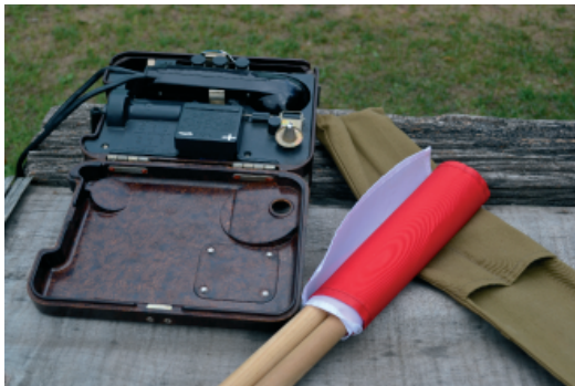
Рис. 2. Локация «Есть связь»

Для участников – это уникальная возможность погрузиться в далёкую для них советскую эпоху, закрепить знания по отечественной истории, приобрести новые для себя умения в сфере военно-прикладной подготовки, и значительно расширить свой кругозор.