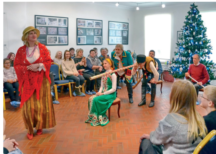
Рис. 1. Театрализованная программа «Святки в доме Веневитиновых», 2020 г.

4) Специальные проекты (с применением форм нестандартного представления образовательного материала), когда музей ведёт целена-