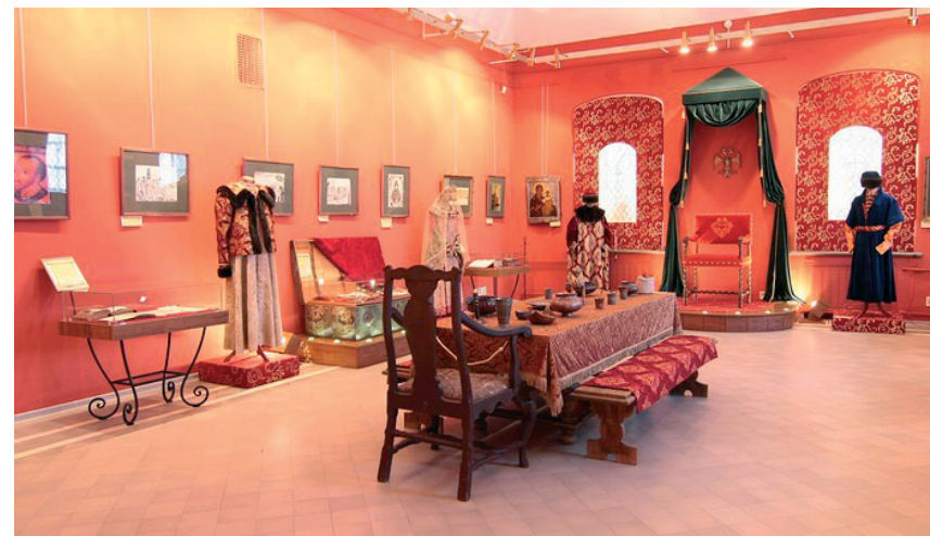
Рис. 1. Костромской государственный историко-архитектурный и художественный музей-заповедник. Экспозиция Романовского музея

Таким образом, невнятная презентация истории края вряд ли может способствовать формированию региональной идентичности. Существует