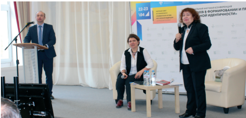
Рис. 4–7. Заседание в Библиотеке имени Горького