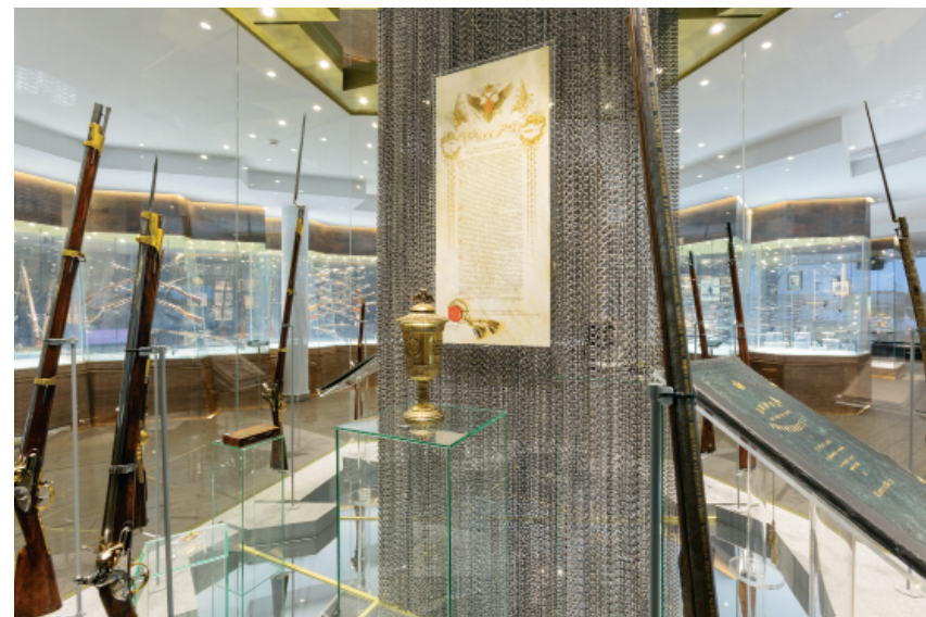
Рис. 1. Коллекция царских ружей, изготовленных на Тульском оружейном заводе в память о его посещении членами императорской семьи