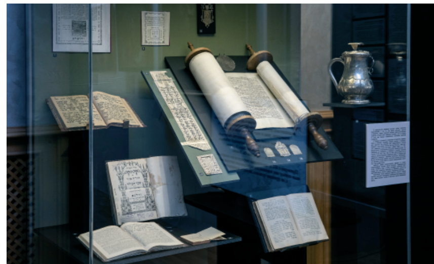
Рис. 2. Витрина «Целительство в иудаизме».

В отдельной витрине размещались предметы, раскрывающие представления о целительстве в иудаизме (рис. 2). В центре витрины расположен Свиток Торы, созданный в Центральной Европе во второй половине XIX – начале XX в., который раскрыт на словах: «Я – Бог, целитель твой». Также здесь представлены молитвенники XIX – начала XX вв. с молитвами о ниспослании здоровья, амулеты, защищающие от болезней и бед, серебряная 1850 г. копилка для пожертвований в пользу больных. Еврейская община в Санкт-Петербурге появилась в конце XVIII в. В 1893 г. с