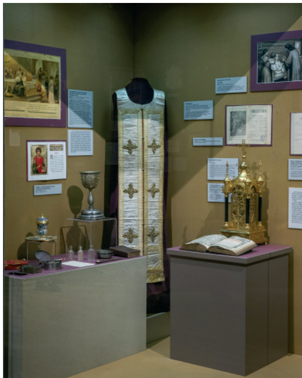
Рис. 1. Витрина «Богослужебный комплекс. Чины врачевания»

комученик Пантелеимон целитель, чья икона была представлена на выставке. В центре Санкт-Петербурга находится каменная Пантелеимоновская церковь, заложенная Петром I в честь победы над шведским флотом при Гангуте в 1720 г. Другими почитаемыми общехристианским святыми целителями являются Косьма и Дамиан, изображённые на картине, написанной в Польше в начале XIX в. В Санкт-Петербурге до 1936 г. на улице Фурштатская находилась Церковь святых Космы и Дамиана лейб-гвардии Сапёрного батальона, построенная в 1876–1889 гг. 2 На сегодняшний день церковь Космы и Дамиана существует при Городской клинической больнице № 31.