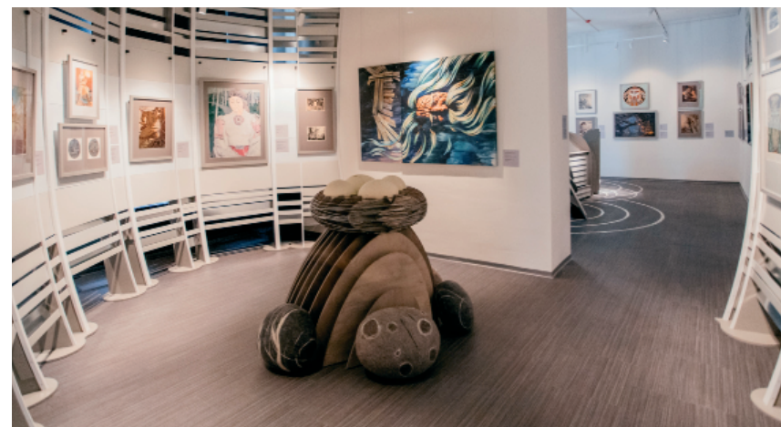
Рис. 1. Экспозиционный раздел «Рождение и трансформация»

Второй зал экспозиции так и называется – «Рождение и трансформация», и показывает сюжеты «Калевалы», посвящённые сотворению мира и рождению первого человека. Проводник зала – главный герой эпоса и первый рождённый человек Вяйнямейнен. Согласно рунам, мир появляется из яиц, снесённых уткой на колене Девы воздуха. Это первая трансформация в сюжете. Символом зала становится яйцо, что вылилось в художественное и дизайнерское оформление зала: стены построены в виде эллипса, что создаёт иллюзию нахождения внутри одного из этих яиц (рис. 1). Тема Вяйнямейнена раскрывается через произведения О. Бородкина (1948), Г. Стронка (1956), Г. Вилкса (1964), Ю. Люкшина (1984), В. Добрынина (1999), представляющие этого героя хоть и седовласым старцем, но сильным, могучим богатырём, вещим рунопевцем, мудрецом и колдуном. Связанная с историей Вяйнямейнена судьба девушки Айно – пример ещё одной мифической трансформации: не пожелавшая выходить замуж за старика юная красавица, упав в воду, не тонет, а превращается в прекрасную рыбу. Это драматическое событие создаёт завязку сюжета поэмы, образует первоначальную пружину её напряженности. Тема раскрывается через образ юной печальной Айно Т. Юфа (1963) и образы Девы-рыбы, созданные Б. Акбулатовым (1986) и Ю. Люкшиным (1985).