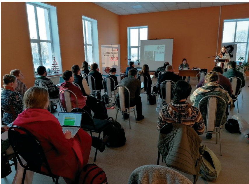
Рис. 3. Поморские чтения 2021 г. в Мезени.

Ежегодно в Оргкомитет конкурса поступает до 15–20 заявок от музейных учреждений. Наиболее популярными являются социально-ориентированные проекты и проекты, связанные с авторским подходом к формированию экспозиционного пространства. Присуждение премий конкурса осуществляется демократическим путём: на Ежегодном совещании директора получают бланк голосований, в котором указывают три лучших проекта, после чего производится простой математический подсчёт. Членами жюри являются все директора – участники совещания.