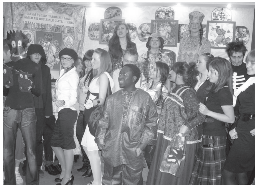
Рис. 2. Студенты-исполнители анимационной программы на открытии выставки «Музей Иванов в Иванове»