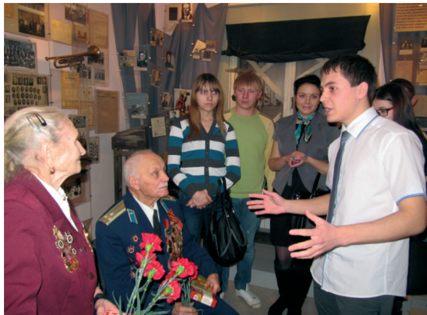
Рис. 2. Встреча студентов с ветеранами Великой Отечественной войны в Музее истории Державинского университета (Тамбов)