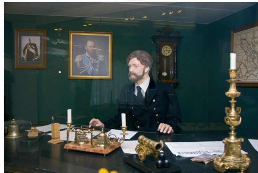
Рис. 5. Национальный музей Республики Карелия. Экспозиция «На статской службе». Чиновничество Петрозаводска в XIX – начале XX вв.»

Сословная структура города продемонстрирована в тематических комплексах «Городские обыватели. Быт Петрозаводска» и «Олонецкое духовенство. Православие в Карелии». Повседневная жизнь губернского города представлена в реконструкциях двух интерьеров: горницы ме-