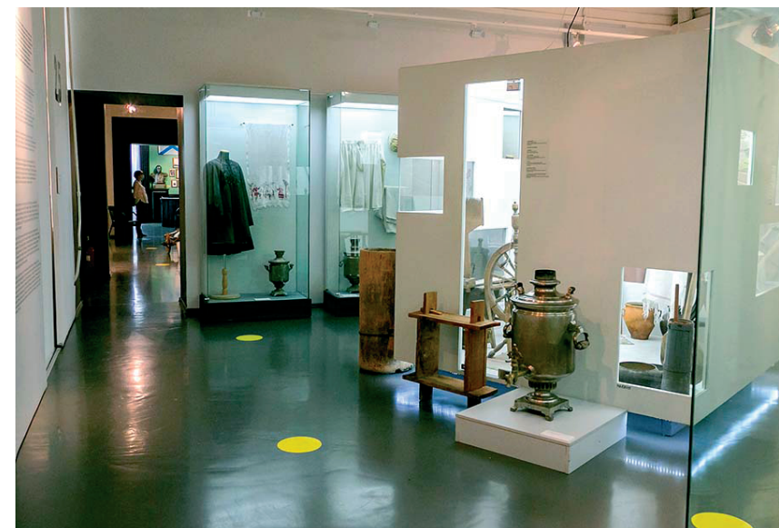
Рис. 4. Музей истории Дальнего Востока имени В.К. Арсеньева. Экспозиция «Время людей»

Наиболее интересен для нас в контексте рассматриваемой темы зал «Время дела». В сценарии написано, что здесь раскрывается тема развития и становления делового Приморья. По замыслу авторов, зал наполнен деловым ритмом, инициативами, персоналиями. Здесь показано, как на кирпичах строится основа для сегодняшнего Владивостока. Интерактивный познавательный модуль позволяет непосредственно оценить деловую хватку первых людей бизнеса, осваивавших Приморье, и рассматривать деятельность как «изменяющееся качество изменяемого мира». В действительности – вдоль стены выстроен модуль, в ячейках которого помещены образцы кирпичей с клеймами разных предпринимателей, в центре – инсталляция из мебели, представляющая кабинет делового человека. Напротив выстроен такой же модуль, где в ячейках размещены современные банки, мешки, упаковки, наполненные продуктами и предметами, которые должны символизировать торговлю рассматриваемого