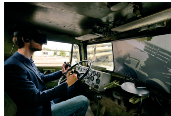
Рис.2. Комплекс виртуальной реальности РСЗО «Смерч», разработанный группой студентов Тульского государственного университета

Ещё одна форма работы, направленная на сохранение и почитание памяти о тульских оружейных традициях, зародилась в 2012 г., когда Правительство РФ утвердило профессиональный праздник – День оружейника, отмечаемый по всей стране 19 сентября. В этот день музей бесплатно принимает в своих стенах всех тульских оружейников.