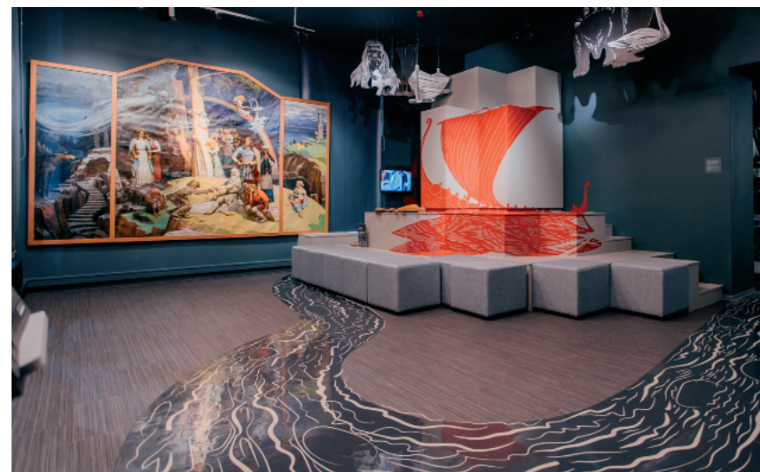
Рис. 3. Экспозиционный раздел «Приключения и подвиги продолжаются»

Эта «Скала» также многофункциональна, в её недрах прячутся столы и стулья для мастер-классов, а сама она может стать зрительным залом: с противоположной стороны опускается экран, зрители могут сидеть на ступеньках горы и смотреть кино на темы «Калевалы».