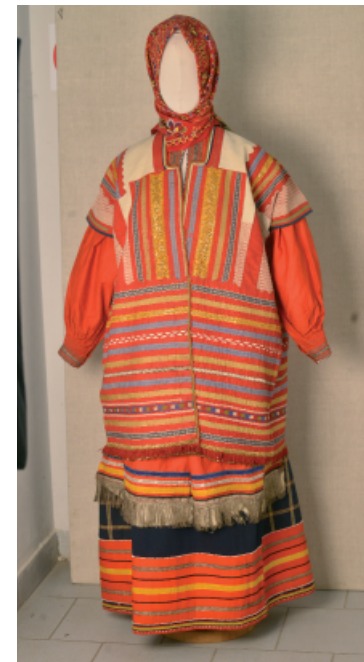
Рис. 2. Женский костюм: рубаха, понёва, передник. Рязанская губ., Михайловский у., с. Жокино. 1917 г. Работа М.В. Анисимовой.

2022 год ознаменован юбилеем отдела «Русское народное и декоративно-прикладное искусство XVIII – начало XXI вв.», которому исполняется 100 лет. Оценивая вклад сотрудников народного отдела в дело сохранения и приумножения национальной культуры, убеждаешься, что главное, чем музей может гордиться – это обширные и разнообразные по своему составу коллекции народного искусства, собранные усилиями нескольких поколений, и труд, вложенный в их сохранение, изучение и популяризацию.