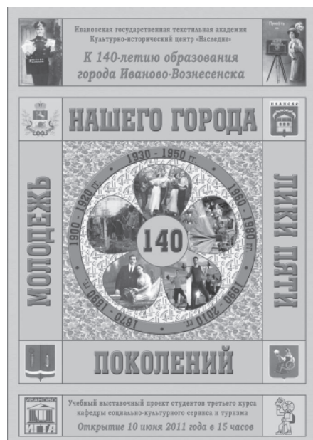
Рис. 3. Афиша выставки «Молодёжь нашего города: лики пяти поколений».

В центре внимания экспозиционной части проекта находился раздел, посвящённый деятельности М.В. Фрунзе в Иваново-Вознесенске на протяжении всего десяти месяцев 1918 г. Это единственный, по существу, период в его жизни до начала Гражданской войны, когда на пер-