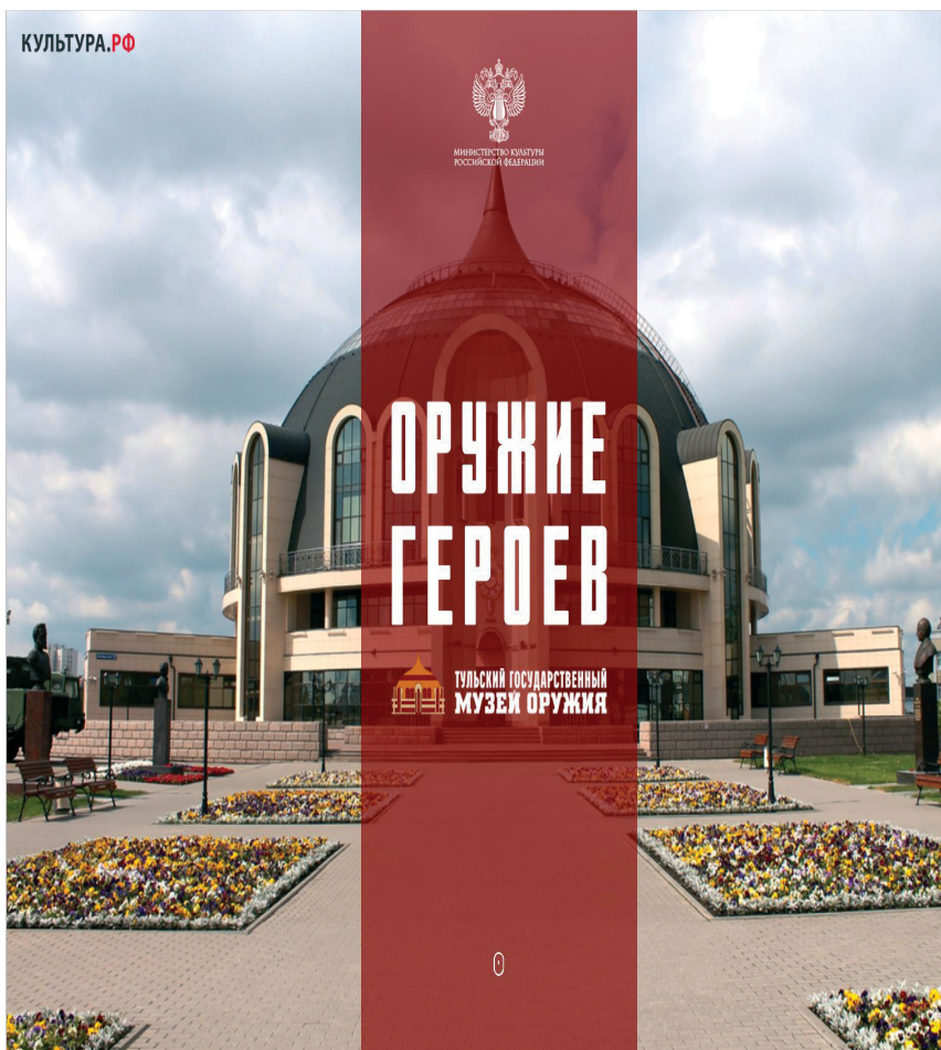
Рис.3. Проект виртуального музея «Оружие героев», представляющий в 3D-формате наиболее значимые образцы русского оружия

Архангельский краеведческий музей (далее – АКМ) традиционно является методическим центром для остальных музеев Архангельской области, оказывая методическую и практическую помощь в организации работы и подготовке новых экспозиций. Как филиалы областного музея были организованы и начинали свою деятельность Соловецкий государственный историко-архитектурный и природный музей-заповедник, Северодвинский городской музей, музеи в Котласе, Красноборске, Онеге и др.