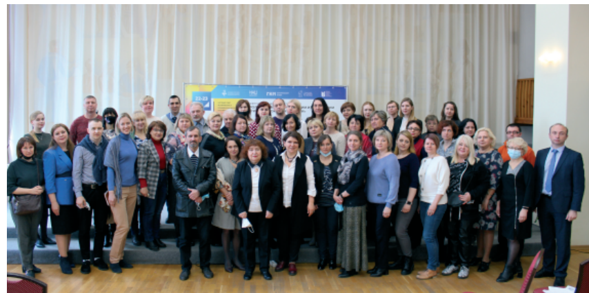
Рис. 1. Открытие конференции и Научного совета

Шестое заседание Центрального филиала Научного совета исторических и краеведческих музеев РФ состоялось 22–23 апреля 2021 г. в Рязани. В рамках совета была проведена Межрегиональная научная конференция «Роль музеев в формировании и презентации региональной идентичности» 1 (рис. 1).