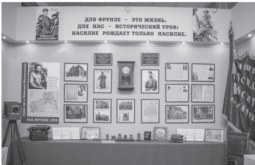
Рис. 4. Центральная часть экспозиции «Имени М.В. Фрунзе»

вый план вышли усилия по организации мирной жизни населения города: решению острых проблем его продовольственного обеспечения, хозяйственно-экономическому развитию и культурному строительству в предельно урбанизированном Иваново-Вознесенске, снискавшем славу «Русского Манчестера». Именно здесь наиболее ярко проявились сущностные черты личности Фрунзе, его нравственные императивы, его представления о человеческой справедливости, его интеллект, воля, выдающиеся организаторские способности.