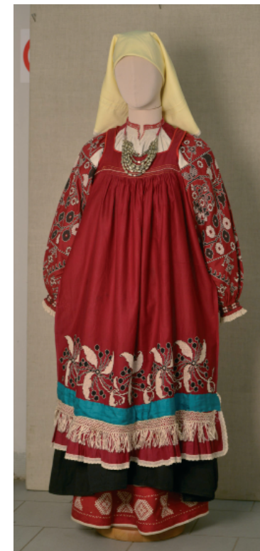
Рис. 1. Женский костюм: рубаха, подстава, сарафан, передник-запон, пояс, платок, ожерелье из девяти рядов стеклянных бус. Рязанская губ., Сапожковский уезд, слобода Верховинская. 1900-е гг. Работа А.В. Постниковой

Особый интерес для исследователей представляет традиционный текстиль Рязанской губернии XIX – XX вв., т. к. в нём наиболее ярко отразилась вся этническая специфика Рязанского края. Данный раздел в составе собрания СПМЗ – самый большой по количеству (ок. 1500 предметов). Он охватывает отрезок времени с середины XIX до середины XX в., позволяя проследить те изменения, которые произошли в крестьянском костюме на протяжении целого столетия. Отдельные уникальные образцы обрядовой одежды можно отнести к первой половине XIX в.: детали «духовского» и погребального костюмов, богато вышитые и тканые рукава старинных рубах, подола передников. В коллекции – несколько десятков полных костюмных