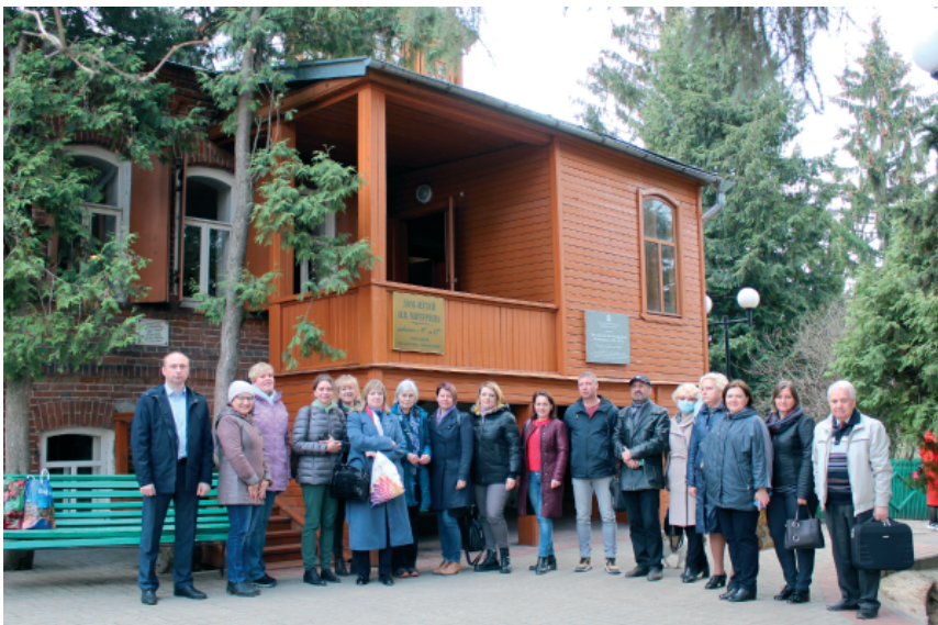
Рис. 10. В Доме-музее И.В. Мичурина