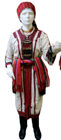
Рис. 1. Праздничный костюм девушки (мордва-эрзя восточной группы). Нач. XX в.

Главным украшением костюма была вышивка – плотная и ажурная, с преобладанием красного цвета. Орнамент вышивки состоял из особых элементов, несущих определённый смысл. Так, в орнаменте рубах, головных уборов, нагрудных и поясных украшений мордвы зачастую присутствуют зигзаги и наклонные параллельные линии, символизирующие воду, которая во многих мифах является первоос-